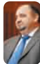
ZLATKO MEHUN, glasnogovornik Vlade

S obzirom na to da je ministar Božidar Kalmeta napismeno obećao sindikatima da izgrađene autoceste neće ići u koncesiju, iako je premijer Ivo Sanader još prošloga tjedna tvrdio da će o tome tek biti donesena odluka nakon što radna skupina analizira sve mogućnosti, upitali smo glasnogovornika Vlade Zlatka Mehuna tko čini tu skupinu. On nam je pojasnio da je Ministarstvo mora, prometa i infrastrukture formiralo tu stručnu skupinu koja treba analizirati prednosti i nedostatke davanja autocesta u koncesiju. Prema Mehunovim riječima, ta će analiza nakon završetka biti poslana na Ekonomsko vijeće koje će onda donijeti odluku hoće li se ići u koncesiju ili ne.